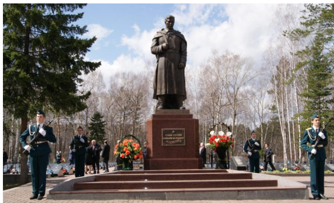
мемориал на Южном кладбище, г. Томск

Несмотря на то, что с момента окончания Великой Отечественной войны прошло уже 70 лет, многие ее страницы так и остаются непрочитанными. Не все погибшие захоронены. До сих пор на местах боев находят безымянные останки, а многие семьи так и не узнали о